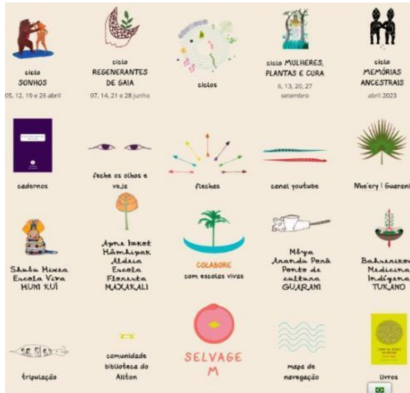
Figura 1 – Atividades realizadas pela Comunidade Selvagem

pelo grupo Biblioteca do Ailton e pelo trabalho realizado com o grupo de Crianças para o desenvolvimento de materiais pedagógicos.