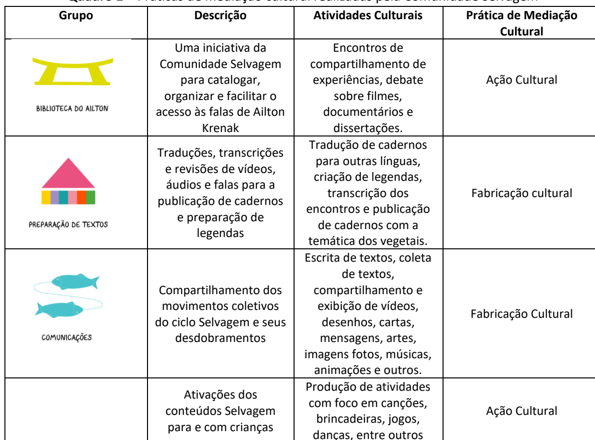
Quadro 1 – Práticas de mediação cultural realizadas pela Comunidade Selvagem

No ícone tripulação é descrita toda a rede de colaboradoras e colaboradores da comunidade selvagem e da Biblioteca do Ailton Krenak e o ícone comunidade indica formas de colaborar para a ampliação do acervo da biblioteca do Ailton krenak. No ícone mapa de navegação é possível consultar os relatórios das ações do grupo nos anos anteriores, trazendo, dessa forma, amplo acesso à informação e divulgação das ações para viabilização do projeto. No ícone de livros é possível comprar as obras produzidas pelo projeto. Por fim, após descrevermos a Biblioteca do Ailton Krenak, seu acervo e seu Catálogo Colaborativo, assim como a estrutura do site onde ela está localizada, ressaltamos a sua importância da iniciativa como espaço de informação sobre saberes dos povos originários, principalmente àqueles produzidos e disseminados pela oralidade. Além dessas ações, temos outras atividades culturais, que estão diretamente relacionadas as práticas de mediação cultural, como é apresentado no quadro 1.