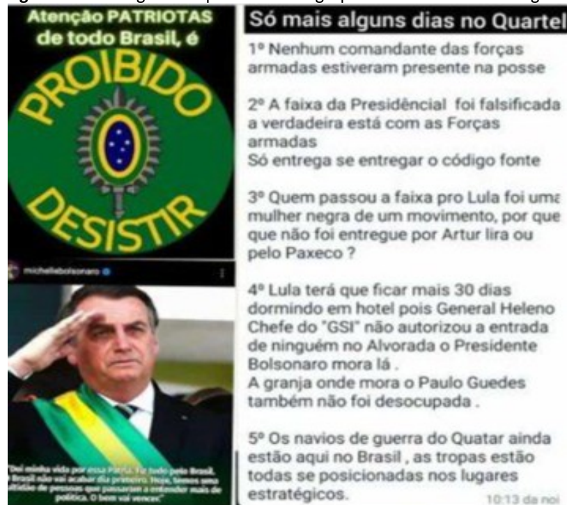
Figura 1 – Mensagem compartilhada em grupos bolsonaristas no Telegram