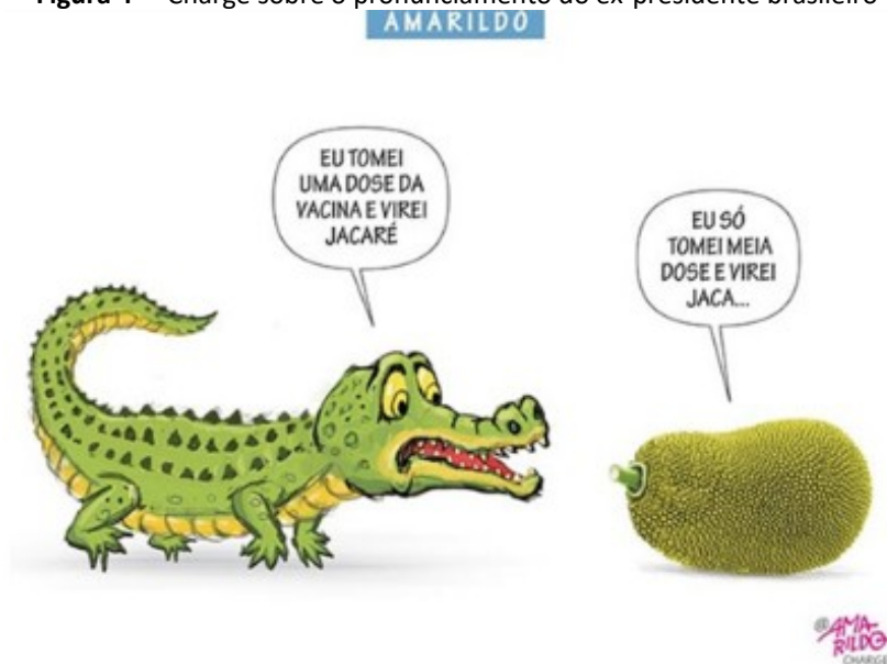
Figura 4 – Charge sobre o pronunciamento do ex-presidente brasileiro

Se você virar um chi... virar um jacaré, é problema de você, pô. Não vou falar outro bicho, porque vão pensar que eu vou falar besteira aqui, né? Se você virar super-homem, se nascer barba em alguma mulher aí ou algum homem começar a falar fino, eles não têm nada a ver com isso. Ou, o que é pior, mexer no sistema imunológico das pessoas (BOLSONARO, 2020 apud PEDRIALI, 2021).