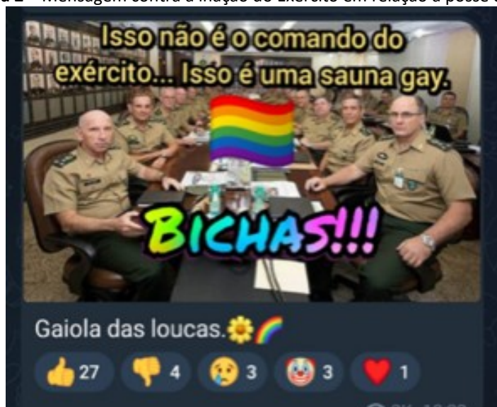
Figura 2 – Mensagem contra a inação do Exército em relação à posse de Lula