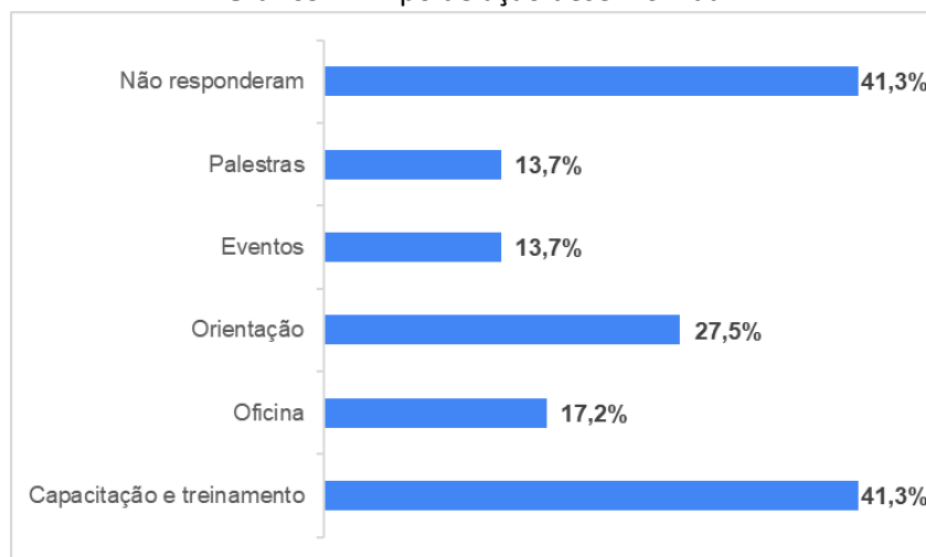
Gráfico 4 – Tipo de ação desenvolvida