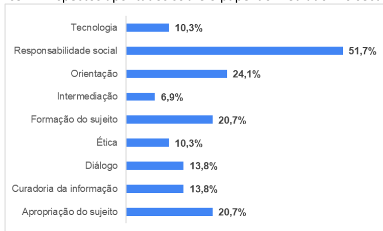
Gráfico 2 – Aspectos apontados sobre o papel do mediador no século XXI