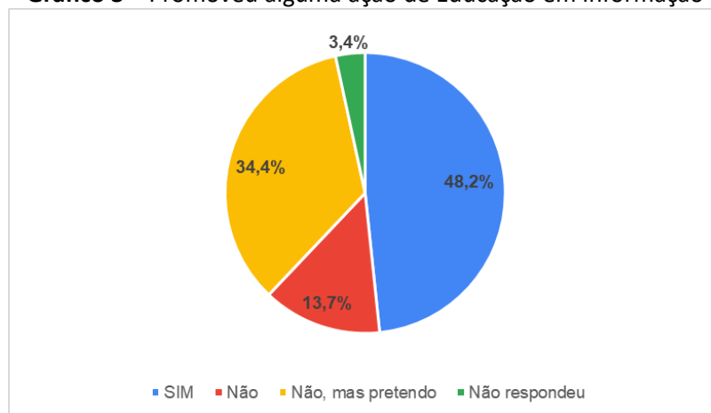
Gráfico 3 – Promoveu alguma ação de Educação em Informação

Além de verificar a percepção quanto às competências infocomunicacionais, ao papel do mediador e à educação em informação, buscou-se identificar se os arquivistas e bibliotecários que participaram da pesquisa já promoveram alguma ação educativa em informação (Gráfico 3).