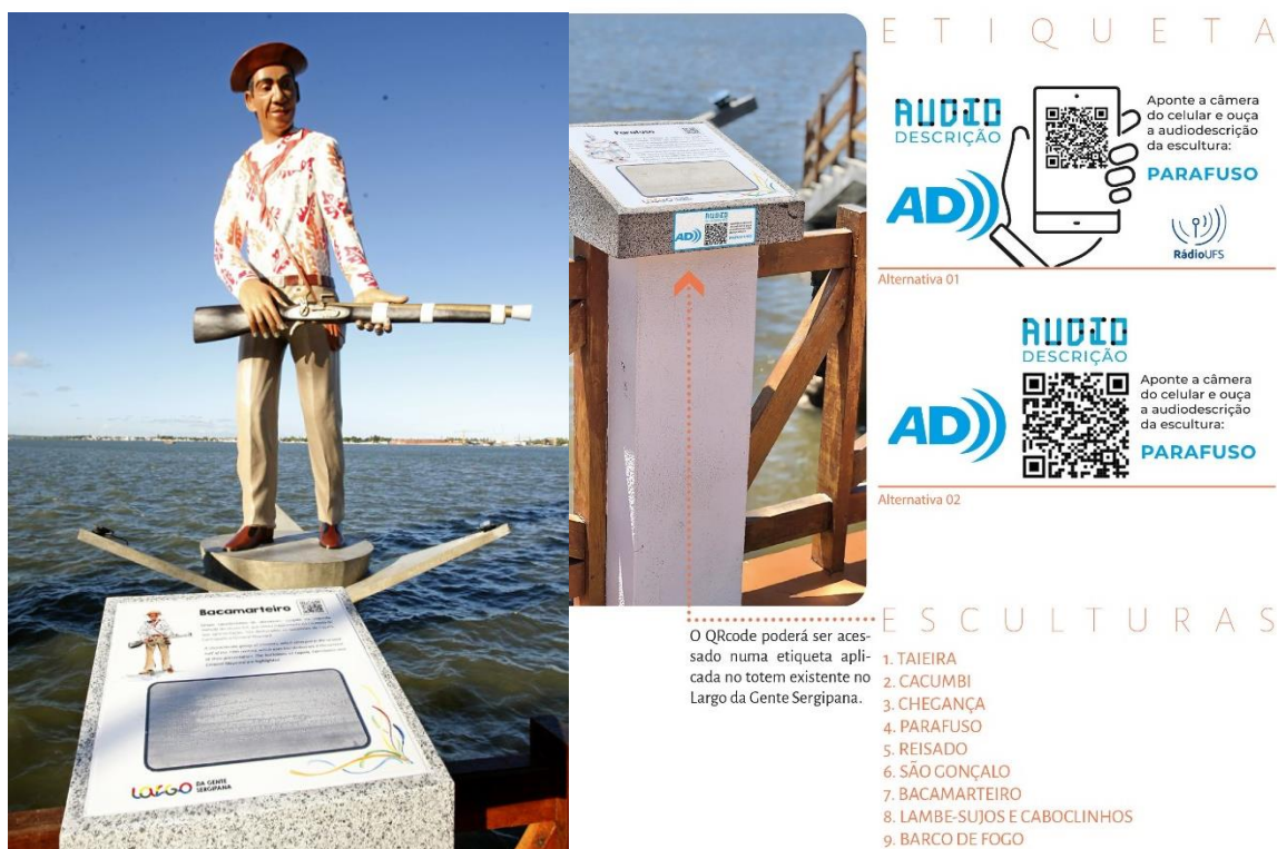
Figura 2 – AD aplicada ao totem informativo das esculturas do Largo da Gente Sergipana