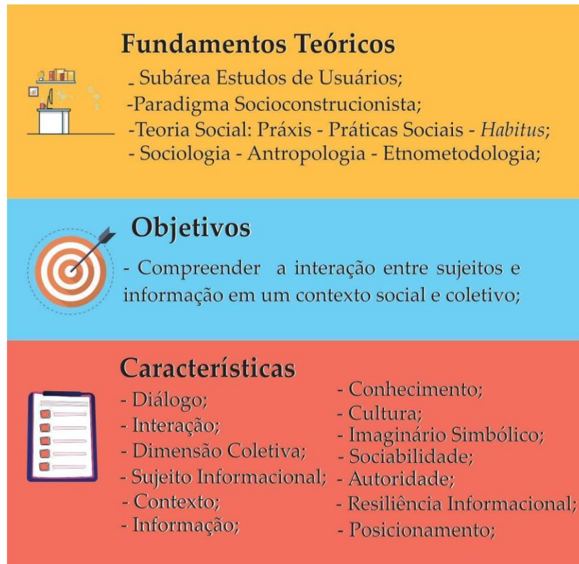
Figura 2 – Estrutura conceitual de Práticas Informacionais