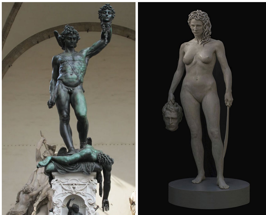
Figura 2 - Perseu e Medusa em duas perspectivas artísticas