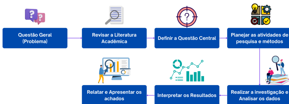
Figura 1 – Etapas da Aprendizagem Baseada em Pesquisa (RBL)

A RBL promove a construção da compreensão dos estudantes, o desenvolvimento de saberes prévios, a interação social e o aprendizado significativo por meio de experiências reais. O modelo RBL adota abordagens como o aprendizado autêntico, resolução de problemas e trabalho cooperativo, sendo reconhecido como um formato de aprendizado eficaz para as demandas da educação superior, neste caso para o ensino de Medicina (Wessels et al. , 2021). A metodologia busca formar estudantes com habilidades de comunicação, competências analíticas e técnicas, adaptabilidade, capacidade de trabalho colaborativo e, simultaneamente, espírito competitivo. As fases incluem formular uma pergunta ou hipótese, a revisão de literatura, o planejamento de atividades investigativas, a coleta e análise de dados, e a interpretação dos resultados. Finalmente, a elaboração e apresentação de relatórios consolidam o aprendizado, permitindo que os alunos demonstrem suas descobertas (Arifin et al. , 2022; Susiani; Salimi; Hidayah, 2018).