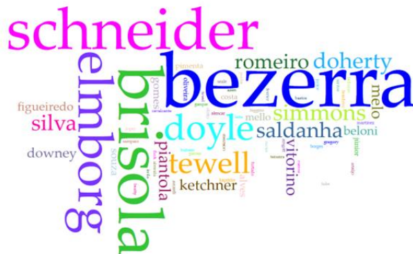
Figura 1 – Autores mais citados como referencial teórico da CCI

trabalhos), seguidos de James Elmborg, autor estadunidense mais citado (30 trabalhos). A nuvem de palavras abaixo mostra os autores e autoras mais referenciados (Figura 1).