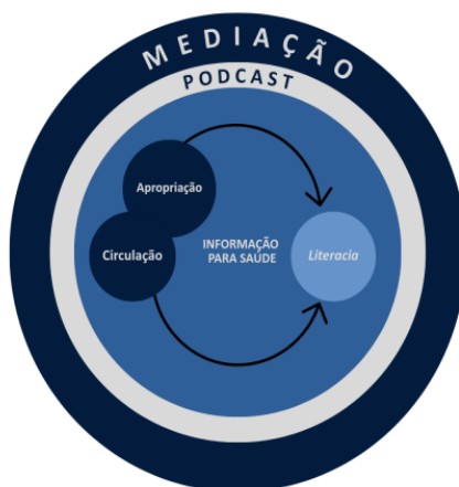
Figura 1 – Relação entre o podcast e a informação para saúde

Nesse sentido, tendo a mediação como algo associado ao desenvolvimento das necessidades informacionais dos sujeitos, essa relação se torna possível. Assim, por meio das TDIC, essa ambientação está no ciberespaço, enquanto os sujeitos estão inseridos na comunidade de ouvintes do podcast. Assim, a Figura 1 representa uma das possibilidades desse processo de mediação no âmbito da informação para saúde, com vistas ao estabelecimento de literacia em saúde. Reitera-se que esse processo mediacional pode ser gerador de novas buscas por parte das comunidades, com vistas a compreender melhor os temas explorados. Fortalece-se, nesse contexto, o desenvolvimento da literacia em saúde no público.