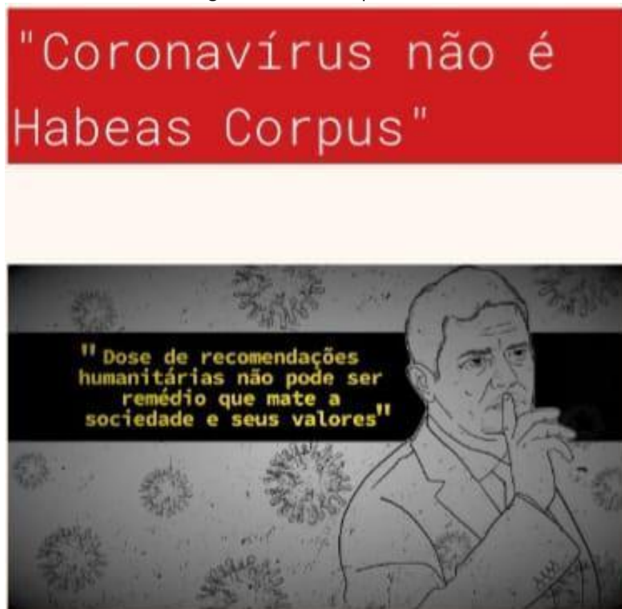
Figura 2 – Núcleo expositivo 1.