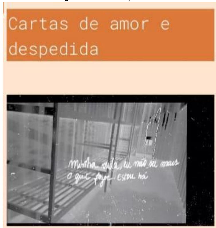
Figura 3 – Núcleo expositivo 2.