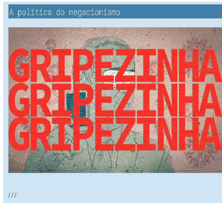
Figura 4 – Núcleo expositivo 3.