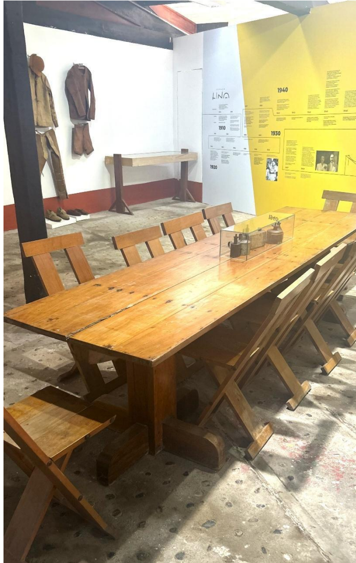
Figura 8 – Mesa com cadeiras Frei Egídio – autoria de Lina

investigação sobre o mobiliário vernacular e funcional, a peça também integra o conjunto de cadeiras do auditório Gregório de Mattos, em Salvador, reafirmando seu compromisso com uma estética moderna enraizada nas práticas e nos saberes populares.