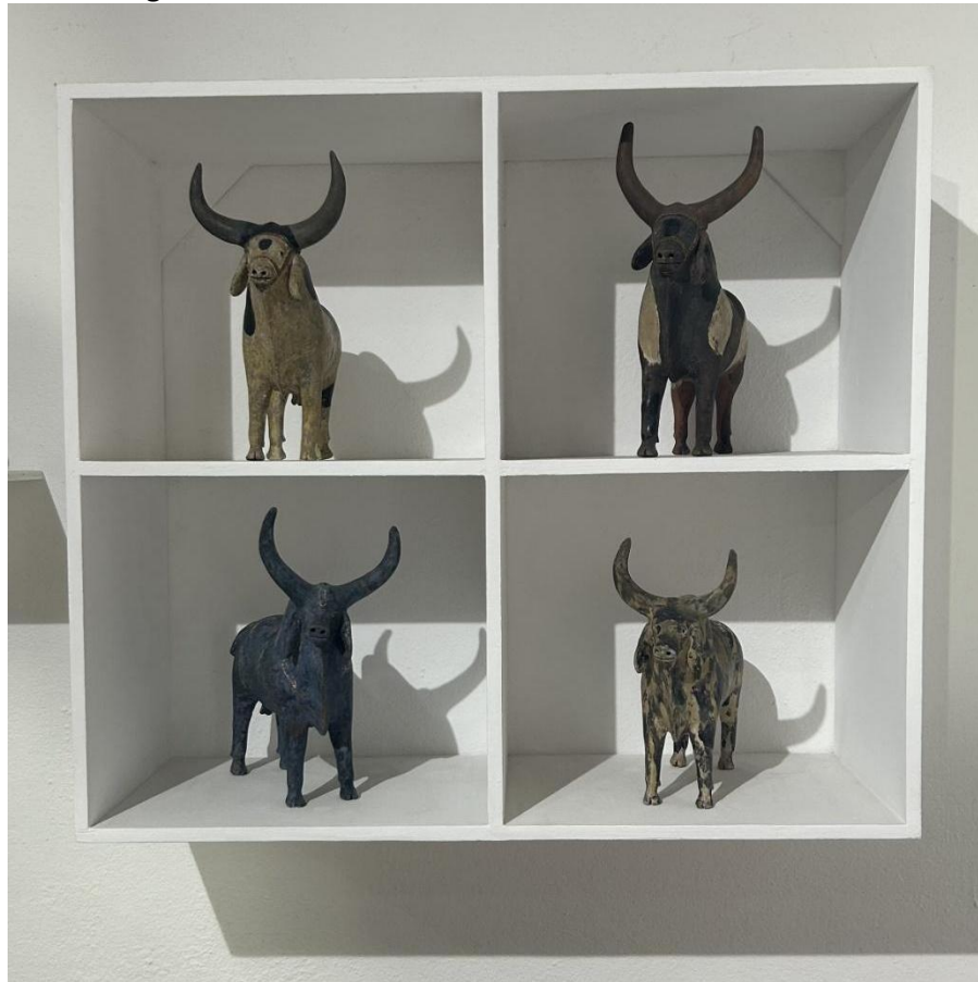
Figura 5 – Touros de cerâmica do Mestre Manuel Eudócio