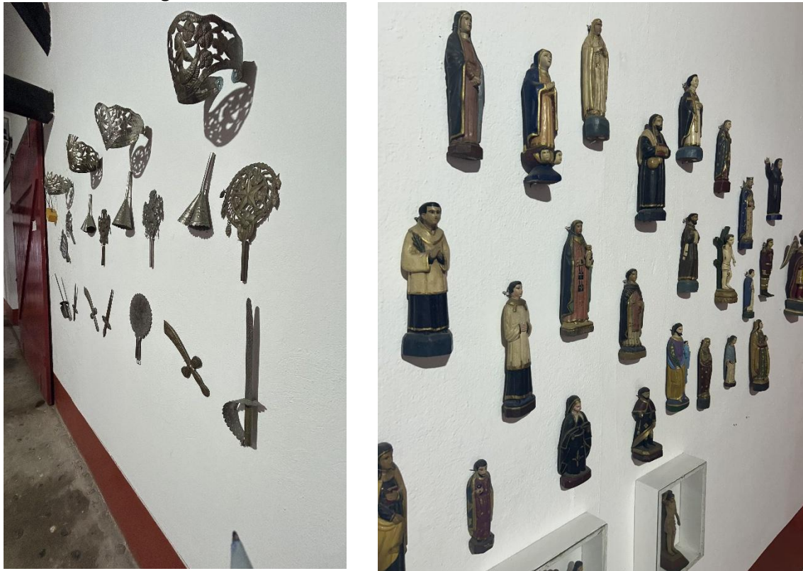
Figura 6 – Sincretismo – artefatos da cultura africana e arte sacra