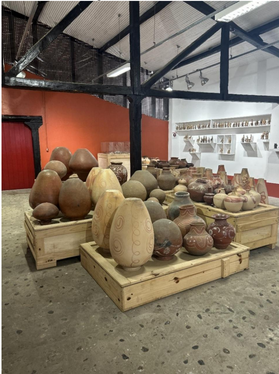
Figura 3 – Núcleo Cerâmicas