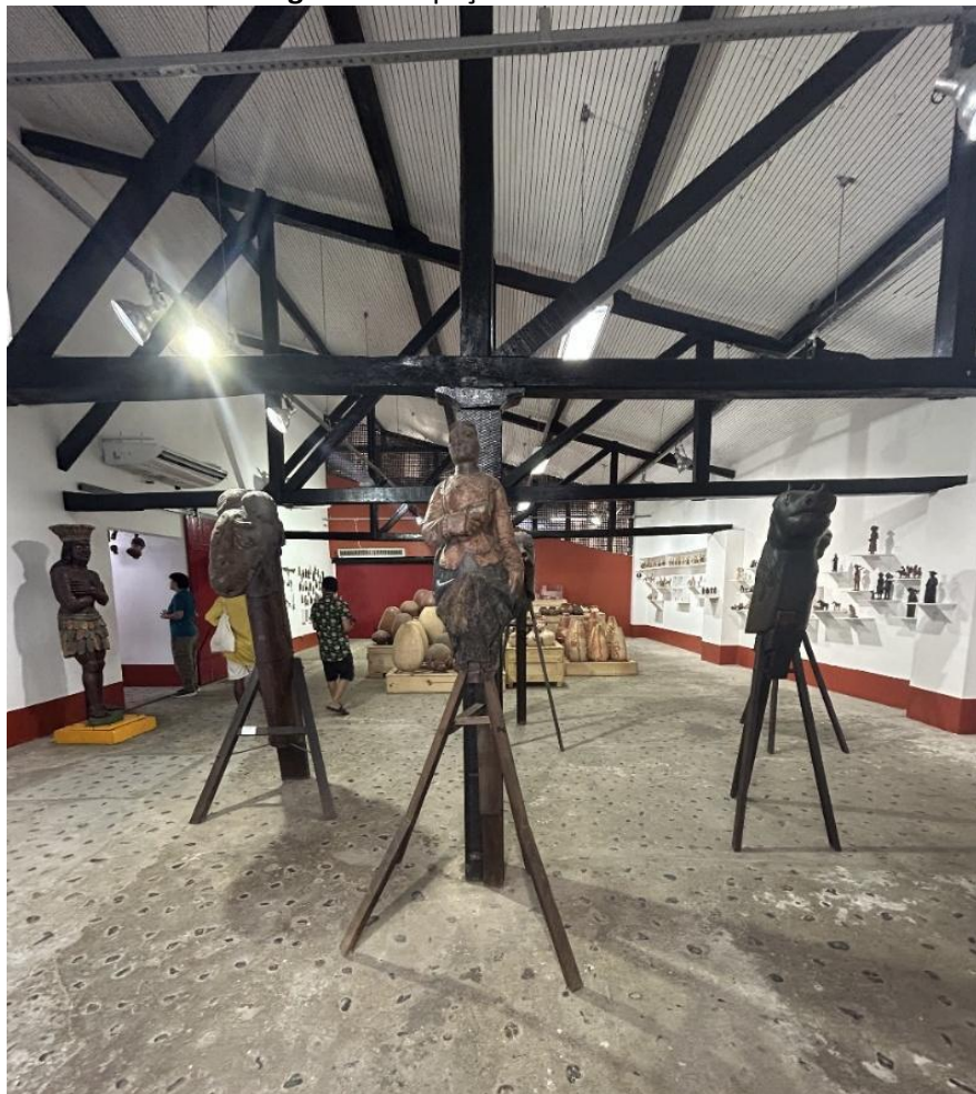
Figura 2 – Espaço Lina no MAM-BA

O suporte expositivo utilizado em forma de tripé permite que as carrancas ganhem altura e inclinação, gerando uma sensação especial ao visitante, tanto de imponência quanto de, imageticamente, transportar o ideário à ponta do barco, onde elas originalmente existem.