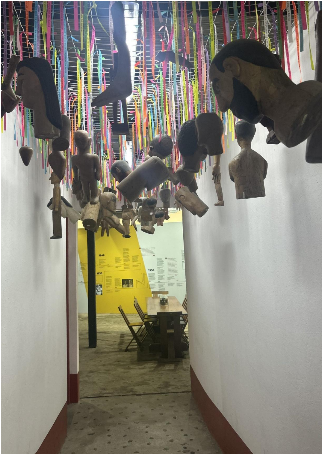
Figura 7 – Ex-votos