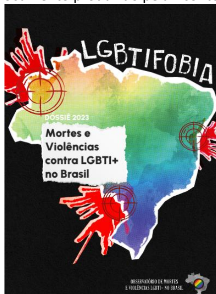
Figura 4 – Exemplo de documento produzido pela Acontece Arte e Política LGBTI+

A Acontece Arte e Política LGBTI+, tem produzido o Dossiê de Mortes e violências contra LGBTI+ no Brasil, em parceria com a ANTRA e a ABGLT, por meio do Observatório de Mortes e Violências LGBTI+ no Brasil. Essas três instituições se unem para coletar dados estatísticos e produzir um dossiê que revela as violências que essa população sofre. Esse documento apresenta o perfil das vítimas, com informações sobre a idade, orientação sexual, identidade de gênero, raça e etnia, causa e local da morte, vítimas de suicídio, entre outras informações.