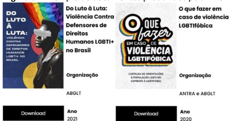
Figura 6 – Exemplo de documentos produzidos pela ABGLT

Quanto à ABGLT, em sua biblioteca, possui publicações diversas, inclusive das instituições já mencionadas acima, mas conta também com e-books próprios, onde constroem conhecimentos sobre pessoas LGBTQIAPN+ voltados a elas mesmas, trabalhando temas importantes para essa população, com o objetivo de contribuir para a redução das violências causadas pela LGBTIfobia.