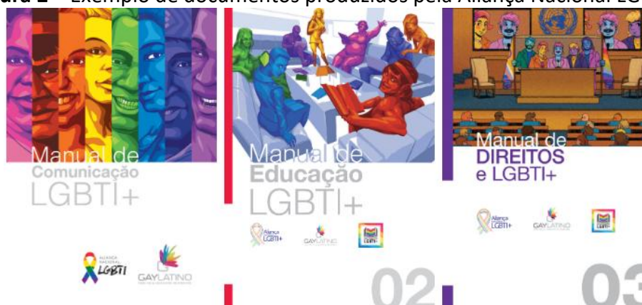
Figura 2 – Exemplo de documentos produzidos pela Aliança Nacional LGBTI+

A Aliança Nacional LGBTI+, entre suas publicações, produz a Enciclopédia LGBTI+, uma coletânea que conta hoje com 26 manuais temáticos, desenvolvidos em parceria com a Rede Gay Latino, trazendo em cada publicação aspectos sobre as vivências das pessoas LGBTQIAPN+, nos quais especialistas de cada área elaboram esses manuais a partir da perspectiva desse grupo social. Esse programa é um excelente construto epistemológico social, criado por vários profissionais de diversas áreas, com um objetivo em comum: abordar e mostrar a realidade dessa população que sofre com discriminações na sociedade.