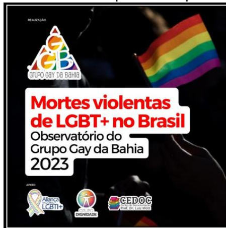
Figura 5 – Exemplo de documento produzido pelo Grupo Gay da Bahia

Trabalho pioneiro, estes documentos são de grande relevância para dialogar junto ao Estado, reivindicando direitos e proteção social, tendo em vista os altos números de assassinatos que essa população sofre. Em parceria com outras entidades, como a Aliança Nacional LGBTI+ e o Grupo Dignidade, de Curitiba, PR, o GGB apresenta dados e informações sobre as mortes de pessoas LGBTQIAPN+.