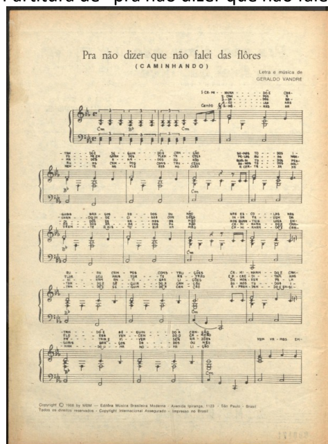
Figura 2 – Partitura de “pra não dizer que não falei das flores”

Fonte: SIAN, Arquivo Nacional ([20--?]) 3