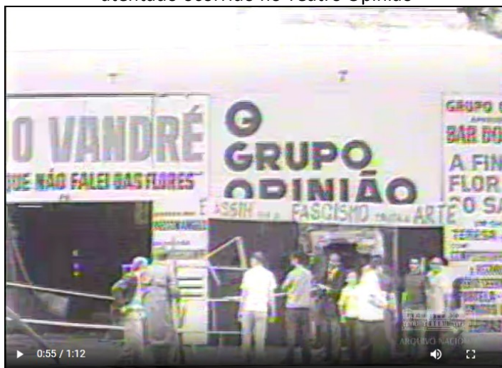
Figura 4 – Print de documento audiovisual do Fundo TV Tupi que registra atentado ocorrido no Teatro Opinião