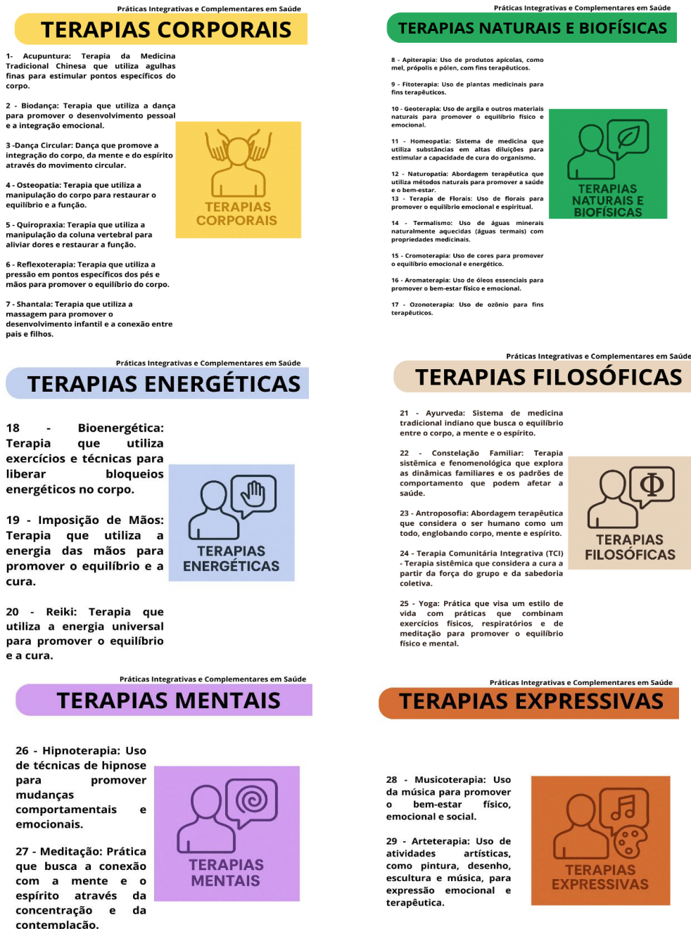
Figura 2 – Categorização das PICS

Diante de tal realidade e a partir das 29 práticas já regulamentadas pelo SUS, utilizou-se critérios de organização da informação (agrupamento de afinidades), foram criadas 6 categorias para agrupar as PICS de acordo com características comuns conforme mostra a figura 2.