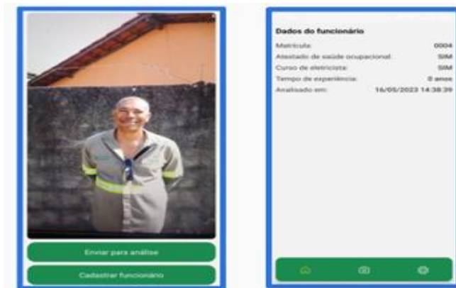
Figura 2 - Reconhecimento facial de um electricista

Nesta etapa, foi proposta uma melhoria no processo de verificação de aptidão da equipe, por meio do uso de reconhecimento facial. Esta verificação será realizada com o apoio de inteligência artificial, por meio de um aplicativo instalado no smartphone do supervisor, garantindo que todos os membros estejam aptos a iniciar as atividades do dia.