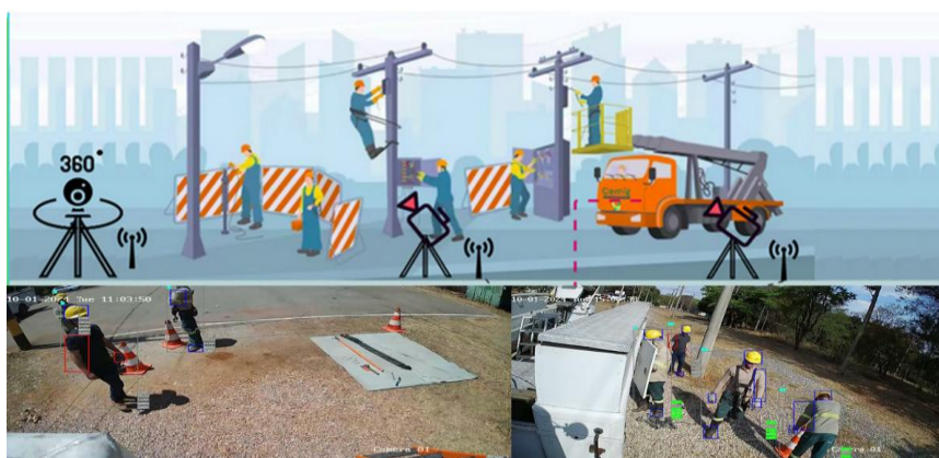
Figura 3 – Proposta de filmagem

Como destacam Shah e Mishra (2024), a visão computacional tem grande potencial para aprimorar a segurança no trabalho por meio de aplicações de IA. Ela permite o monitoramento da conduta dos funcionários, a identificação de riscos potenciais e o envio de alertas em tempo real, reforçando a relevância dessa abordagem no contexto da supervisão de equipes em campo.