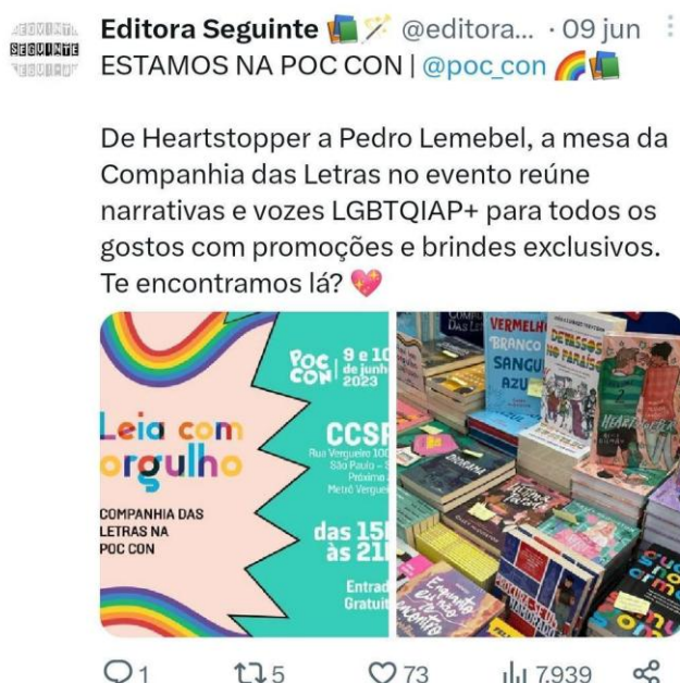
Figura 2 – Companhia das Letras marca presença na POC CON 2023

Embora seja evidente, mesmo com as políticas públicas e as lutas das minorias, que a sociedade é marcada por preconceitos, violência e intolerância, ressaltamos que a resistência às opressões e discriminações continua firme, combatendo os estigmas que aprisionam e adoecem o coletivo. Diante das múltiplas formas de se ter inclusão, temos a literatura e o poder que o leitor tem ao se tornar ciente do seu entorno. Conforme Certeau (2013, p. 245) observa, ele é "o produtor de jardins que miniaturizam e congregam o mundo", ou seja, capaz de mudar a realidade vivida em busca de uma conjuntura social mais justa. Logo, a leitura de textos que dialogam com suas vivências proporciona aos leitores novas possibilidades de interpretar e analisar o que está ao seu redor, mesmo em situações de discriminação e intolerância (Petit, 2008).