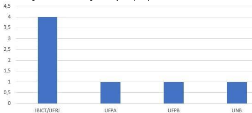
Gráfico 2 - Programas de Pós-graduação que produziram trabalhos sobre o tema

O Gráfico 2 demonstra que apenas quatro Programas de Pós-graduação em Ciência da Informação no Brasil possuem trabalhos relacionados ao tema da nossa pesquisa.