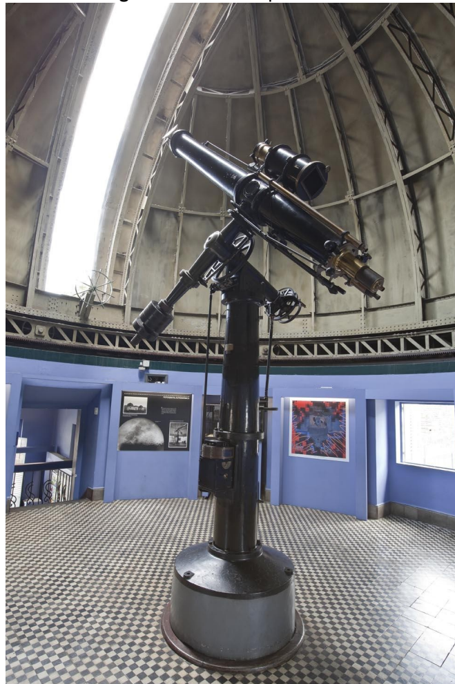
Figura 1 – Luneta Equatorial 21

O instrumento, registrado sob o número 1994/0135, é mais conhecido como Luneta equatorial 21, equatorial de Heyde ou simplesmente luneta 21, numeração referente ao diâmetro da sua objetiva. É equipado com uma câmera, que permite que funcione como uma equatorial fotográfica. A biografia apresentada teve como ponto de partida o já mencionado “Inventário do Major” e o dossiê do objeto no Serviço de Documentação e Conservação de Acervos do MAST.