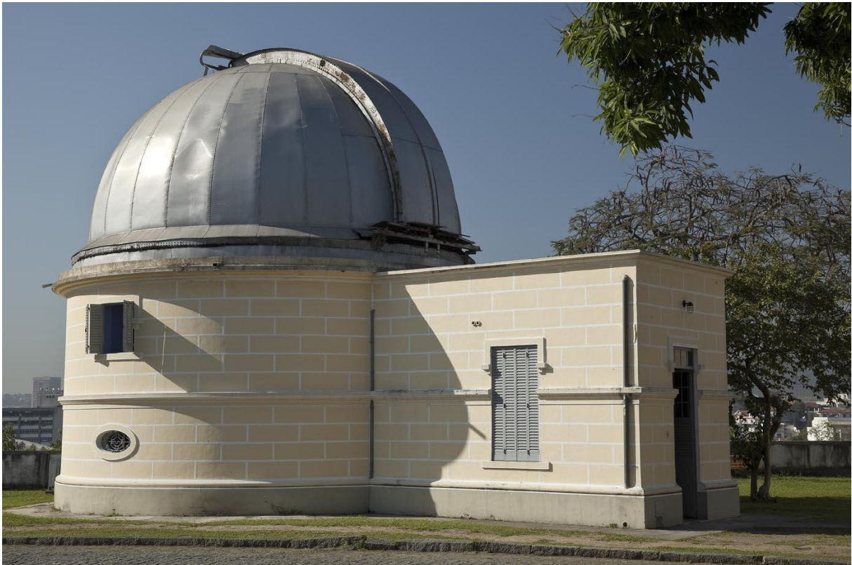
Figura 2 – Pavilhão da luneta 21