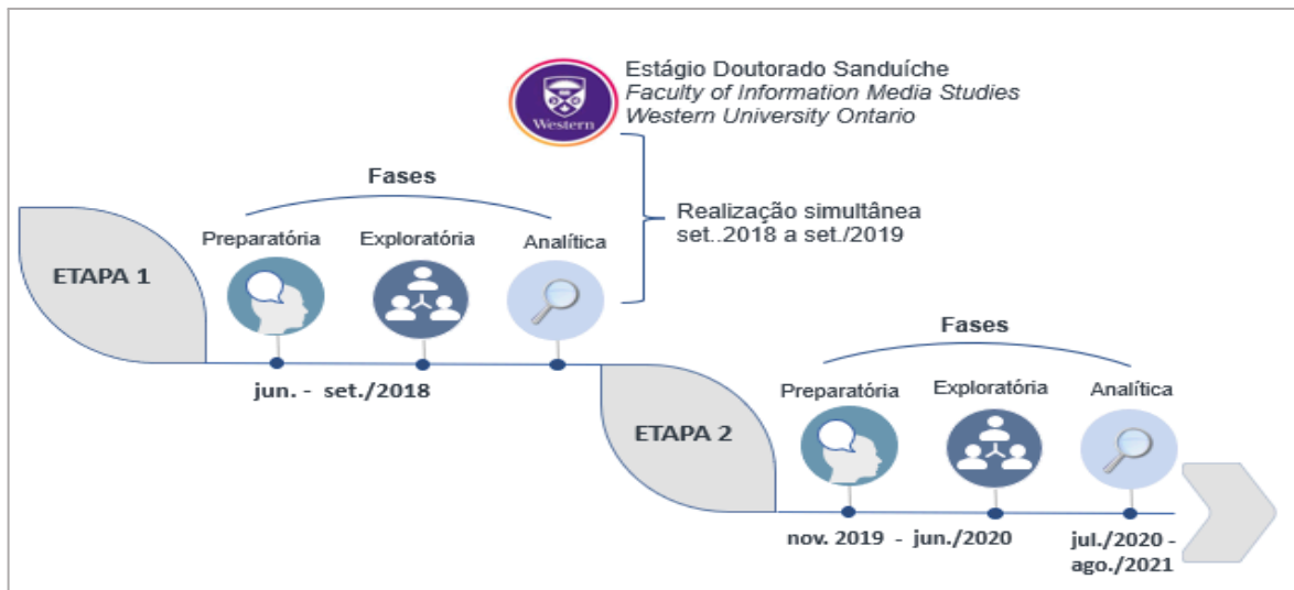
Figura 2 – Etapas e fases da pesquisa de campo