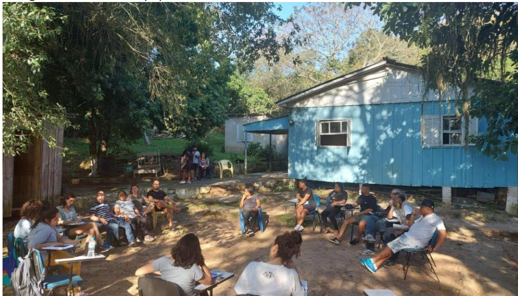
Figura 1 - Reunião equipe NEGA/UFRGS, Frente Quilombola RS e Quilombo Lemos