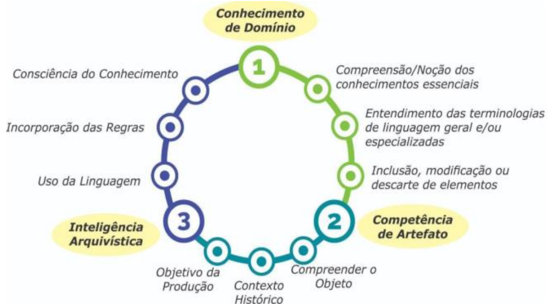
Figura 1 – Indicadores de Conhecimento da Competência Arquivística