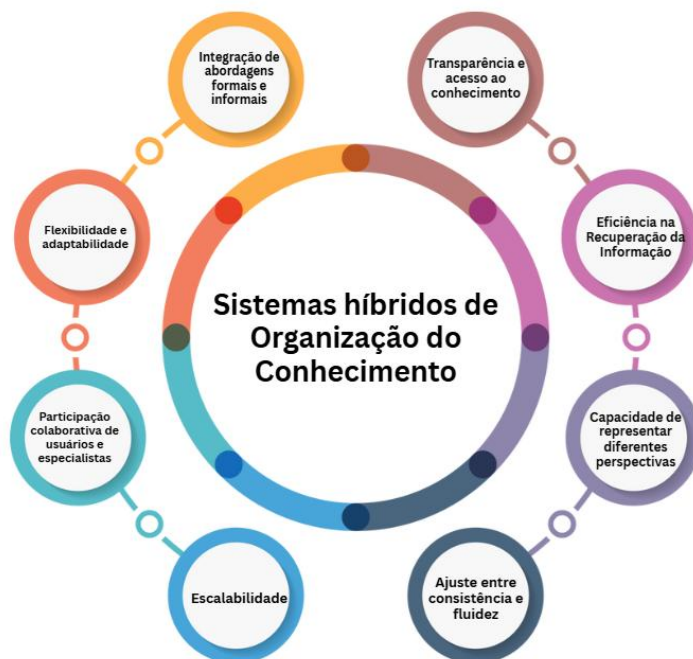
Figura 3 - Principais características dos Sistemas Híbridos de Organização do Conhecimento.

Ao analisar as propostas supracitadas, também foi possível identificar um conjunto de características associadas aos Sistemas híbridos de Organização do Conhecimento, são elas: