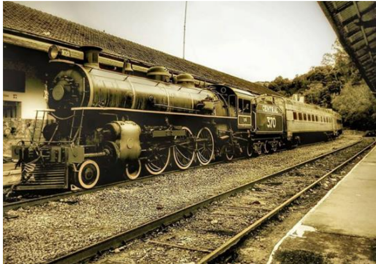
Figura 1 – Locomotiva Zezé Leone

estado de conservação regular, com problemas de manchas escuras, deslocamento de pintura e pequenas rachaduras, sujidade aderida devido à falta de manutenção e limpeza periódica. O Projeto de Restauração da Estação Central prevê uma adequação estrutural, a ser instalada ainda em 2023, com cobertura para acomodar a Locomotiva.