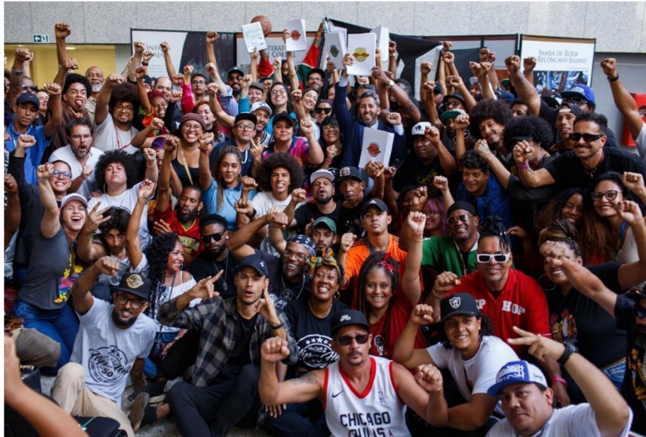
Figura 3 – Entrega do Inventário Nacional da Cultura Hip Hop ao IPHAN

o reconhecimento do Hip Hop como patrimônio cultural imaterial, realizaram uma caminhada partindo da praça Zumbi dos Palmares até a sede do IPHAN em Brasília.