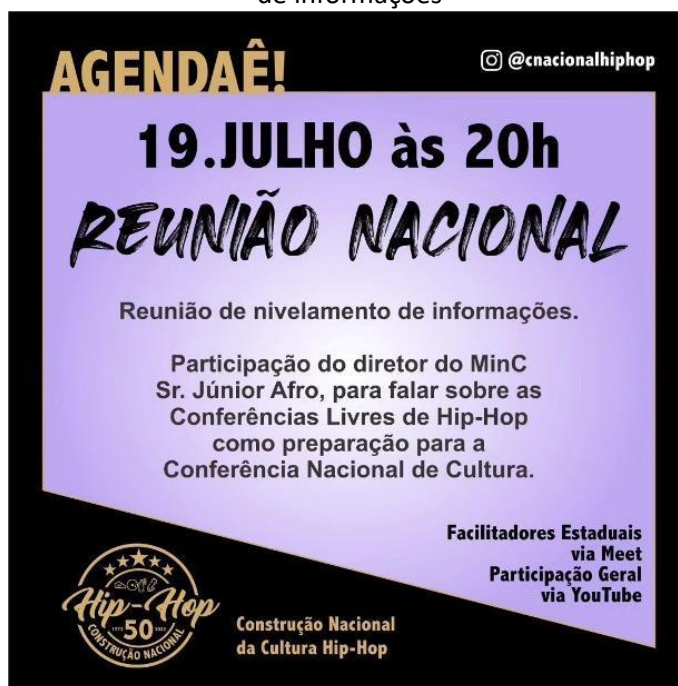
Figura 2 – Card no Instagram da Construção Nacional do Hip Hop divulgando reunião de nivelamento de informações

Fonte: Extraído de Dickel (2025, p. 176)