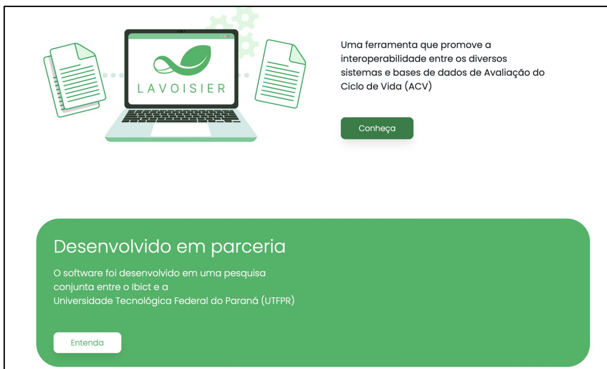
Figura 3 – Página inicial do site Lavoisier.

Fonte: http://lavoisier.ibict.br (2023).