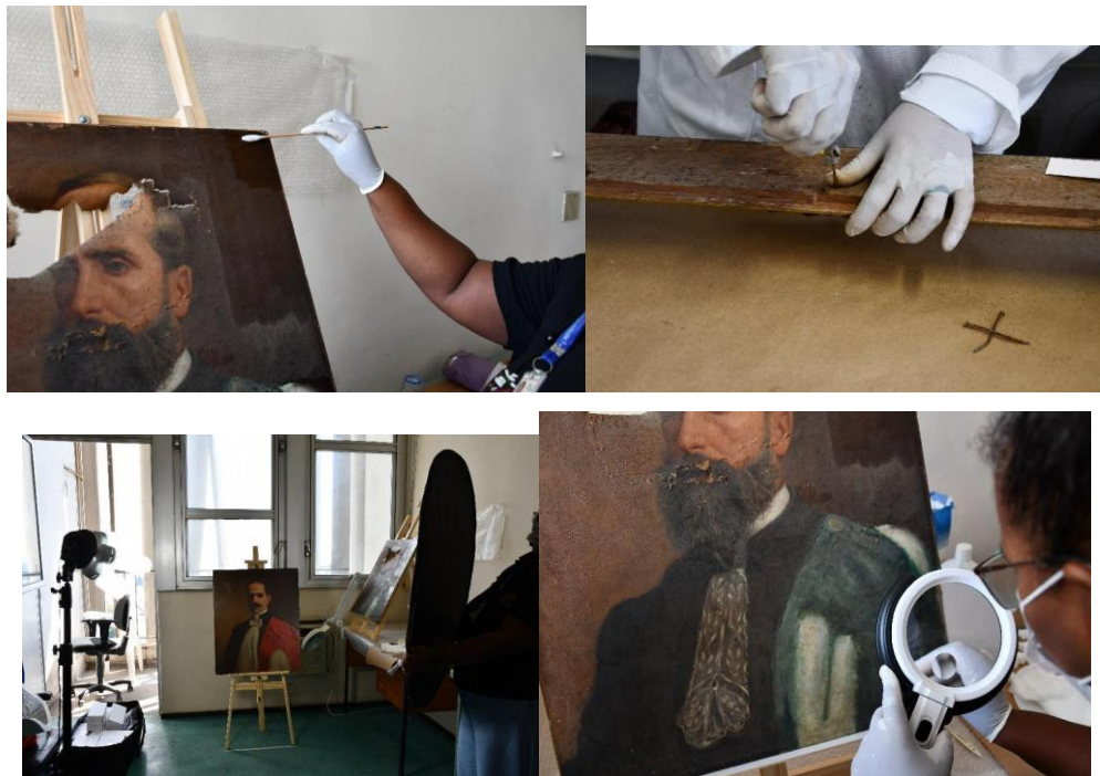
Figura 2 – Registros do acompanhamento de guarda das pinturas e molduras (2023)