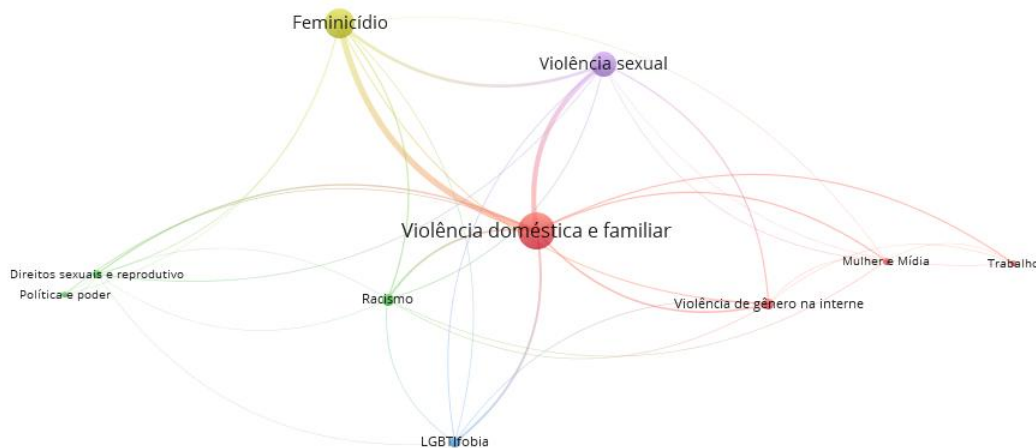
Figura 2 – Rede de coocorrência entre os termos indexados nos artigos sobre violência doméstica e familiar disseminadas pela Agência Patrícia Galvão (2009-2024)

Internet”, “mulher e mídia”, “política e poder”. A Figura 2 apresenta a rede de coocorrência entre os termos indexados nas matérias sobre violência doméstica e familiar examinadas nesta pesquisa.