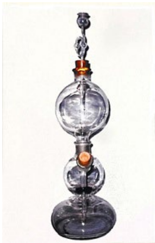
Figura 1 – Aparelho de Kipp