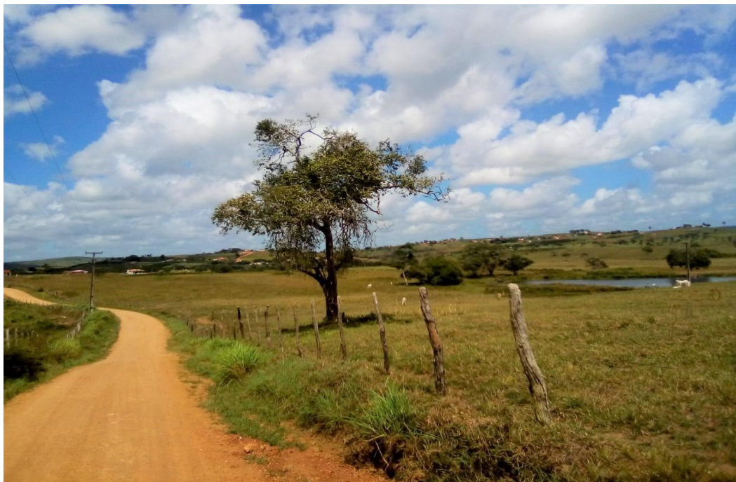
Figura 1 – Roça Agrestiana

desenvolvida no Município de Riachão do Dantas, no Agreste Sergipano, contudo, os atores selecionados residem na roça (figura 1), especificamente nos povoados da Lagoa, Alto do Cheiro e Barro Preto.