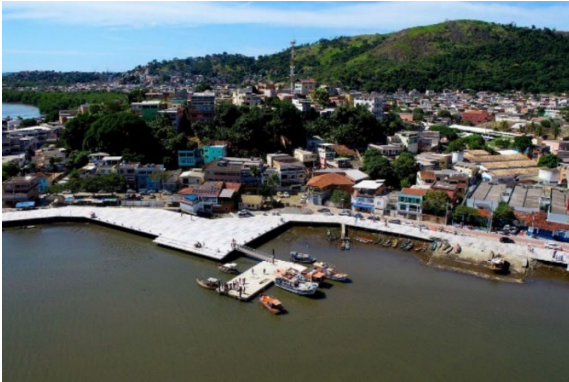
Fotografia 15 - Orla de São Pedro.novos tempos.

Fonte: Fernando Madeira/AGazeta (2024). Disponível em: https://www.agazeta.com.br/es/cotidiano/inauguracao-da-nova-orla-de-sao-pedro-vai-acontecer-no-inicio-de-julho-0624 . Acesso em: 24 maio 2024.