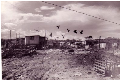
Fotografia 1 – Recanto dos urubus, Bairro São Pedro - 1987