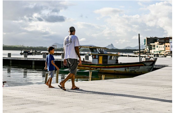
Fotografia 16 - Construindo memórias com as gerações futuras.