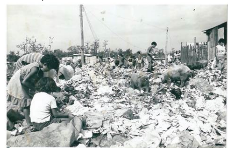
Fotofografia 2 – Lixão sobrevivência, Bairro São Pedro - 1987