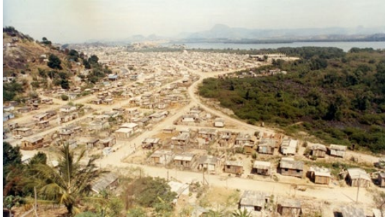
Fotografia 12 - Terra firme

Fonte: Chico Guedes/AGazeta (1993). Disponível em: Disponível em: https://www.agazeta.com.br/es/cotidiano/vitoria-a-cidade-que-cresceu-sobre-a-agua-0221 . Acesso em: 11 set. 2024.