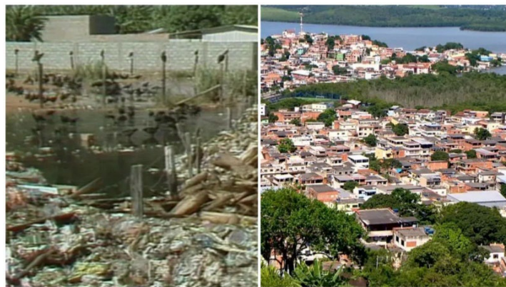
Fotografia 14 - Transformação Social, vida com dignidade.