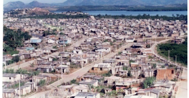
Fotografia 13 - Dignidade ao povo do Bairro São Pedro - 1993