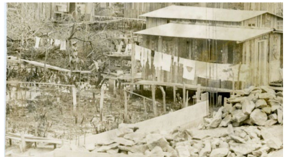
Fotografia 11 - Aglomerado Esperança