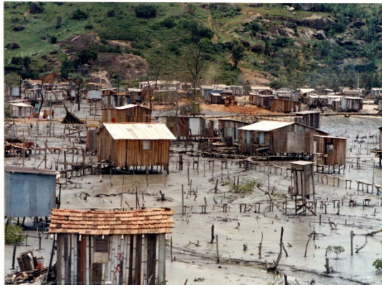
Fotografia 6 - Resort da Desigualdade Social – Bairro São Pedro primórdios