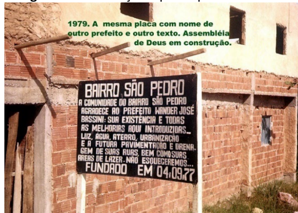
Fotografia 9 - Presença do poder público com obras