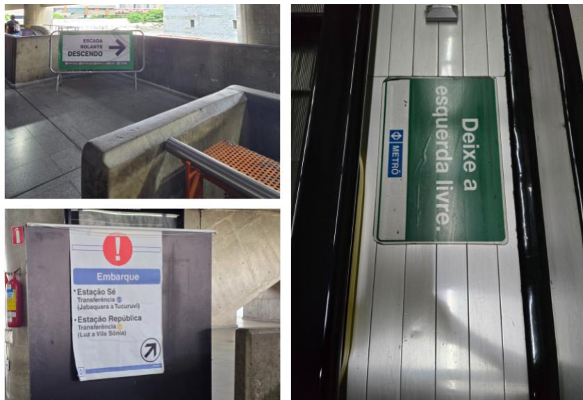
Figura 2 – Sinalizações extras

Nesse contexto, o mapa geral é um grande aliado, mas as placas e sinalizações espalhados pelos espaços contribuem muito no processo, é importante ressaltar que para além das sinalizações permanentes instalados no local que indicam entrada, saída, linhas de metrô, saída para terminais de ônibus, etc., os serviços do metrô devem ser mutáveis e adaptáveis as possíveis instabilidades do serviço ou as novas demandas que surgem no dia a dia. Como exemplo, segue a Figura 2: