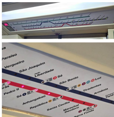
Figura 3 - Painel com as linhas e estações e imagem antes de embarcar no carro do metrô

A Figura 3 apresenta dois desses momentos em que o sujeito é orientado pelas placas e affordances , sendo a primeira dentro do carro do metrô, a qual é possível ver as possibilidades de baldeação e a direção a qual ele está seguindo por meio das luzes no painel – vale lembrar que a cada parada há uma locução em português e inglês do nome da estação, bem como todas as placas no espaço estão em ambas as línguas para informações como saída, embarque e desembarque.