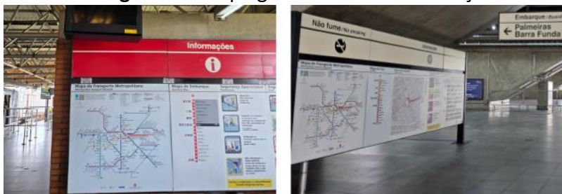
Figura 1 – Mapa geral do metrô na estação do Brás

A Figura 1, demonstra o acesso a esses mapas em diferentes pontos da estação do Brás, a primeira imagem (lado esquerdo) é ao lado da trilha onde ocorrem os embarques e a segunda (lado direito) um andar abaixo deste acesso.