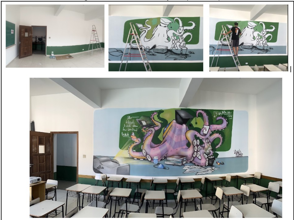
Figura 2 - Processo de elaboração da pintura na parede