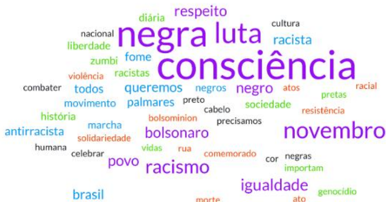
Figura 3 - Nuvem de palavras a partir dos textos dos tweets replicados

7