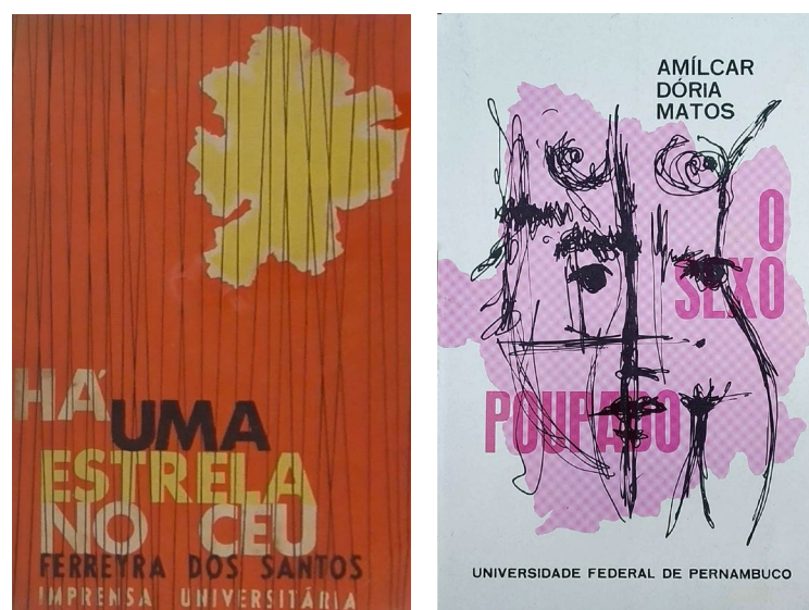
Figura 2 – Capas de Wilton de Souza lançadas em 1965 e 1974, respectivamente