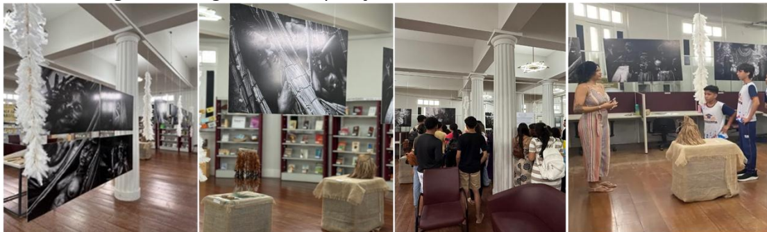
Figura 1 - Registros da exposição no salão de referência da BPBL

A exposição 'Cultura Indígena: um olhar e várias leituras' foi instalada nas dependências da BPBL e, desde então, tem recebido um fluxo constante de visitantes, tanto que passou a integrar o roteiro das visitas guiadas da instituição, servindo como instrumento de mediação cultural, conforme pode ser observado na Figura 1.