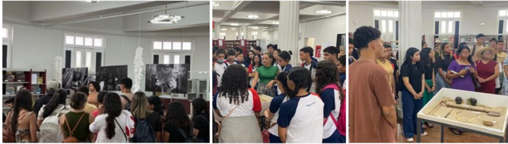
Figura 2 - Registros de ações de mediação cultural na exposição