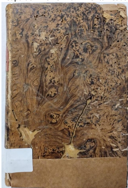
Figura 1 – Capa do livro “O Brazil mental: esboço crítico”

relação entre a cultura bibliográfica material e a sociedade. A pesquisa destaca especialmente as marcas de uso na obra “O Brazil mental: esboço crítico” pertencente ao acervo de obras raras do IHGP, como contributo à construção dos aspectos infomemoriais. Logo, conferir visibilidade e relevância às marcas de posse e uso presentes nesta obra que compõe o acervo raro do século XIX, que integra a coleção de obras raras do IHGP aponta como fortalecimento dos estudos ligados à bibliografia material. A Figura 1 mostra a obra que marca esta pesquisa.