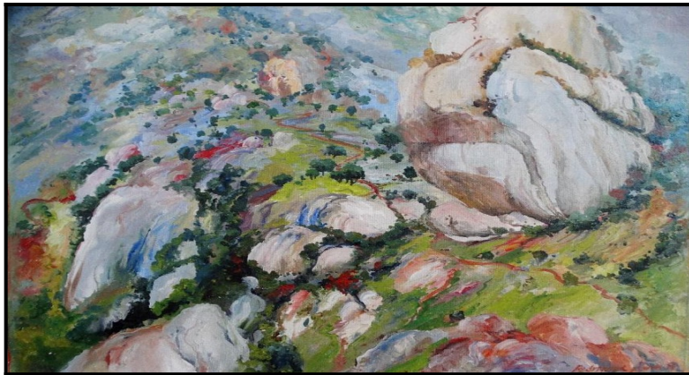
Figura 4 - Pedra do Convento, óleo sobre tela

O lugar desperta curiosidade em muitas pessoas que de imediato, questionam: onde fica? Quem o nomeou? O fato mais recente foi um casal de italianos que ficaram curiosos e demonstraram interesse em uma das pinturas que representa a “Pedra da Reculuta”, nome atribuído pelos nossos ancestrais, que se somam às minhas memórias de Serra Velha.