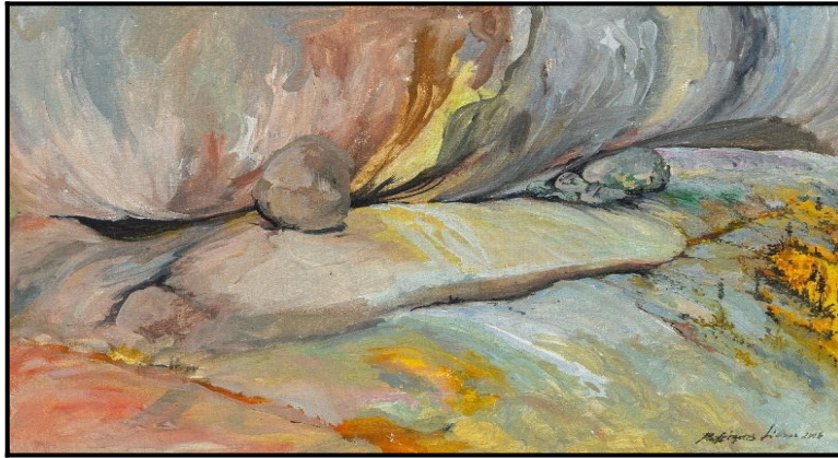
Figura 3 - Pedra da Reculuta, óleo sobre tela