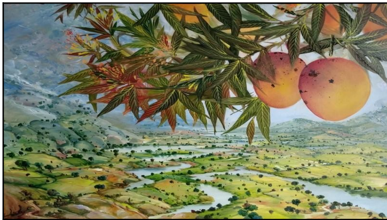
Figura 2 - Manga Rosas de Serra Velha, óleo sobre tela