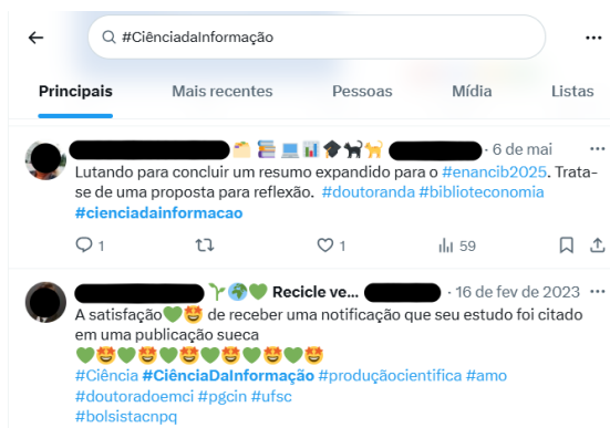
Figura 1 - Uso e recuperação de postagens com a hashtag #ciênciadainformação