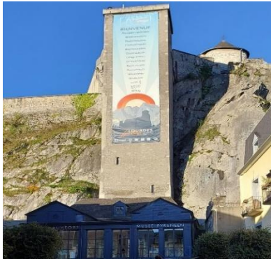
Figura 3 – Torre do Musée Pyrénéen

O Musée Pyrénéen/Château fort de Lourdes localiza-se na região Midi-Pyrénéen, Occitanie, na fronteira com a Espanha, nas proximidades do local religioso de Lourdes (feMs, 2024). Trata-se de um museu de sociedade 7 , instalado num castelo fortaleza cuja monumentalidade pode ser observada nas Figuras 3 e 4, que apresentam a torre e o castelo como vestígios de defesa da cidade de Lourdes durante a Idade Média.