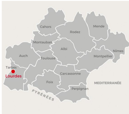
Figura 1 – Mapa de Occitanie