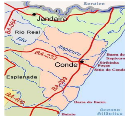
Figura 2 – Estuário do Itapicuru, Siribinha, Conde, Bahia, Brasil