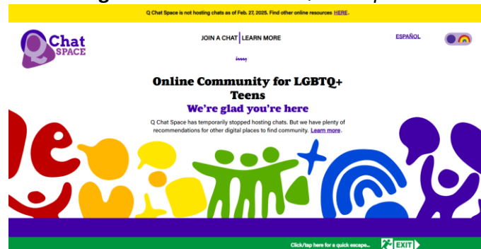
Figura 1 – Interface do Q Chat Space

No entanto, algo que chama bastante atenção está na parte inferior: o botão de acesso “ exit ”, que auxilia o usuário nos casos em que precisa sair rapidamente do site por estar em alguma situação de desconforto ou perigo, uma função pensada para evitar situações de perigo, constrangimento e insegurança. Ao clicar no item, o visitante é automaticamente direcionado para o mecanismo de busca do Google.