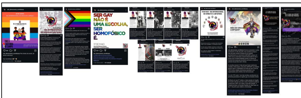
Figura 2 - Postagens do CDC em datas referentes às demandas da comunidade LGBTQIAPN+

Essa categoria contém a análise das postagens acerca das questões da comunidade LGBTQIAPN+, extraídas do perfil CDC nas seguintes datas: 28/07/20; 15 e 17/05/21, 28/06/21; 17/05/22 e 28/07/22; 15/05/23 e 05/06/23. Seguem as postagens agrupadas na Figura 2.