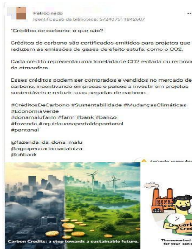
Figura 1 - Anúncio na Biblioteca da Meta categorizado como conteúdo sobre o tema crédito de carbono