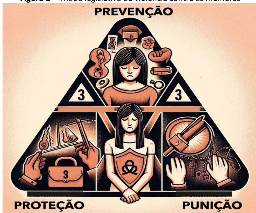
Figura 1 – Tríade legislativa da violência contra as mulheres